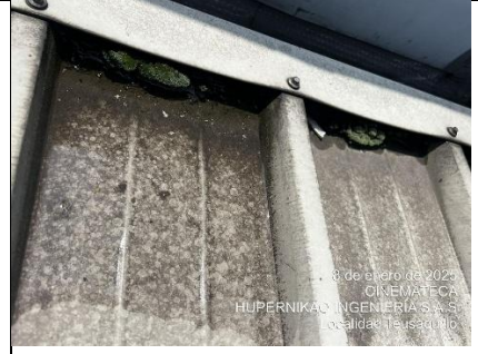
Diagnostico Cinemateca de Bogotá