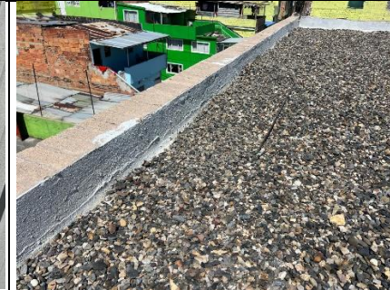
Diagnostico pila 10