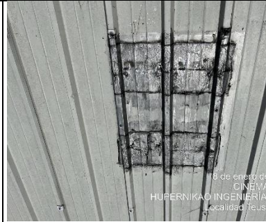
Diagnostico cinemateca cubierta sur