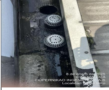
Diagnostico Cinemateca de Bogotá