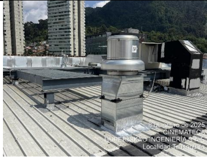
Diagnostico cinemateca cubierta sur