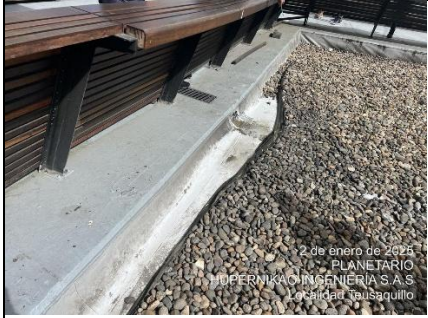
Diagnostico Planetario de Bogotá